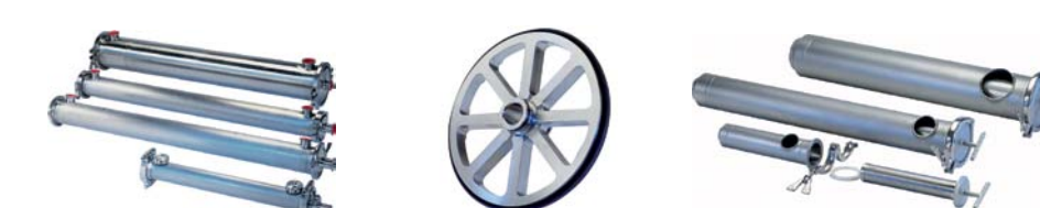
Ház Távtartó Biztonsági szűrők