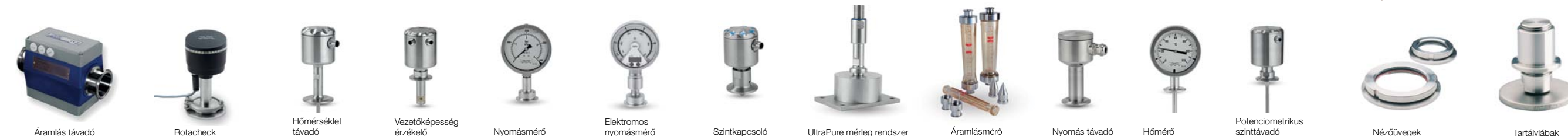
Áramlás távadó Rotachek Hőmérséklet távadó Vezetékképesség érzékelő Nyomásmérő Elektromos nyomásmérő Szintkapcsoló UltraPure mérleg rendszer Áramlásmérő Nyomás távadó Hőmérő Potenciometrius szinttávadó Nézőüvegek Tartályfák