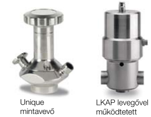
Unique mintavevő LKAP levegővel működtetett