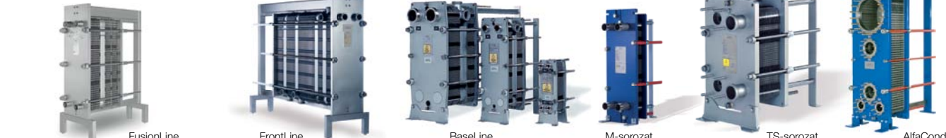
FusionLine FrontLine BaseLine M-sorozat TS-sorozat AlfaCond AlfaVap

Fűzős hegesztett és tömített lemezes hőcserélők