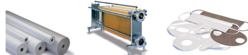
Spirál membrán Lemez és keret membrán (egység) Lapos membránok