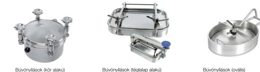
Bűvönnyílások (kör alakú) Bűvönnyílások (téglalap alakú) Bűvönnyílások (ovális)