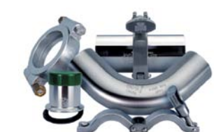
Csővek és fittingek