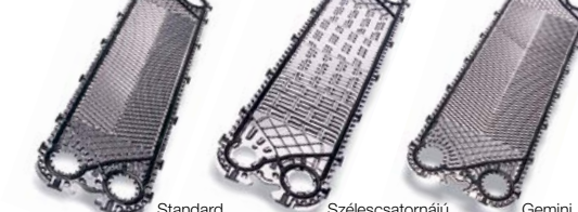
Standard Szélescsatornájú Gemini

Fűzős hegesztési eljárással készült lemezes hőcserélők