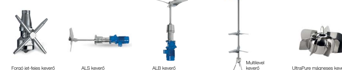
Forgó jet-fejes keverő ALS keverő ALB keverő Multilevel keverő UltraPure mágneses keverő