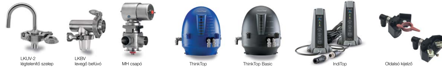
LKUV-2 légtelenítő szelep LKBV levegő befűvő MH csapó ThinkTop ThinkTop Basic IndiTop Oldalsó kijelző