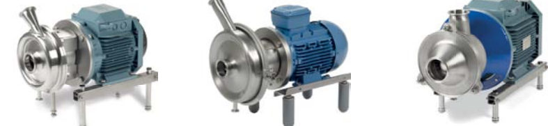
LKH UltraPure SolidC UltraPure MR UltraPure