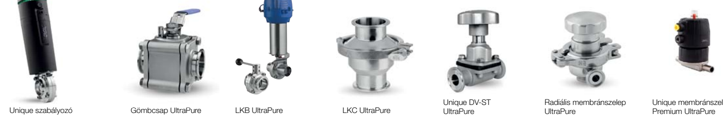
Unique szabályzó Gömbcsap UltraPure LKB UltraPure LKC UltraPure Unique DV-ST UltraPure Radialis membrán szelep UltraPure Unique membrán szelep Premium UltraPure