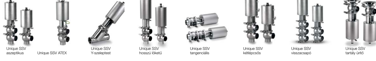
Unique SSV (standard kialakítás) Unique SSV aszeptikus Unique SSV ATEX Unique SSV Y-szeleptest Unique SSV hosszú lőketű Unique SSV tangenciális Unique SSV kétlépcsős Unique SSV visszacsapó Unique SSV tartály ürítő

Manuálisan üzemeltethető Unique SSV manuálisan üzemeltethető Unique SSV kis együlékes