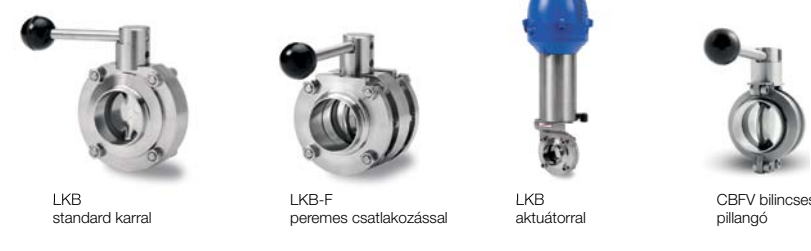
LKB standard karral LKB-F peremes csatlakozással LKB aktuátorral CBFV bilincses pillangó