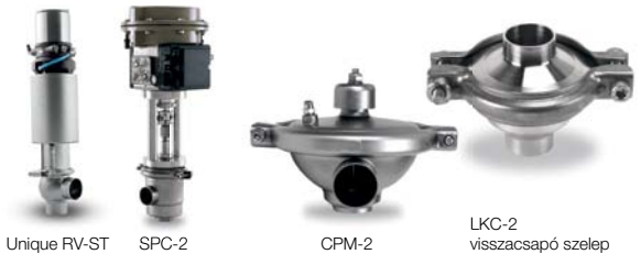
Unique RV-ST SPC-2 CPM-2 LKC-2 visszacsapó szelep