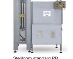
Sterilohm standard PR