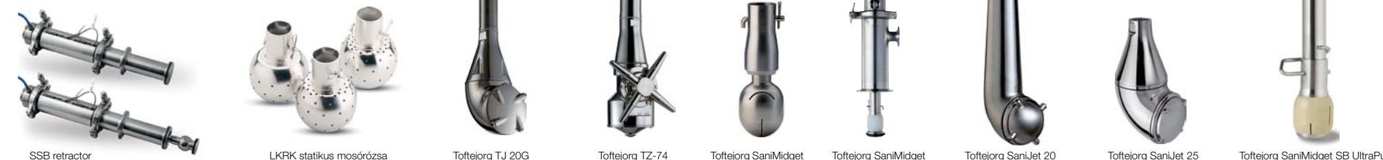
SSB retractor LKFK statikus mosóruzsza Toftejorg TJ 20G Toftejorg TZ-74 Toftejorg SaniMidjet Toftejorg SaniMidjet Retractor Toftejorg SaniJet 20 Toftejorg SaniJet 25 Toftejorg SaniMidjet SB UltraPure