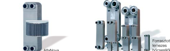
AlfaNova Forrasztott lemezes hőcserélők

Fűzős hegesztési eljárással készült lemezes hőcserélők