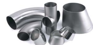
Ívek, T-idomok és szűkítők