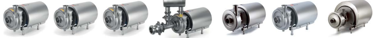
LKH LKH Hex LKH Evap LKHSP LKH PF LKH I LKH Multistage - többlépcsős

Centrifugál szivattyú standard feladatokra