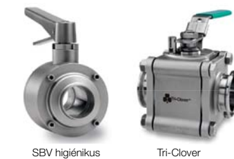
SBV higiénikus Tri-Clover