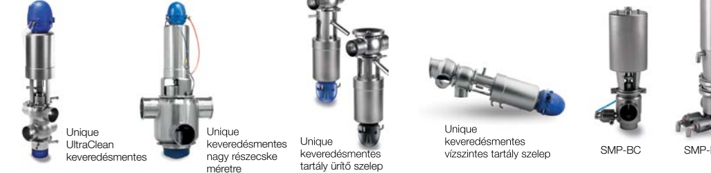
Unique UltraClean keveredésmentes Unique keveredésmentes nagy részecskékre mérete Unique keveredésmentes tartály ürítő szelep Unique keveredésmentes vízszintes tartály szelep SMP-BC SMP-BCA