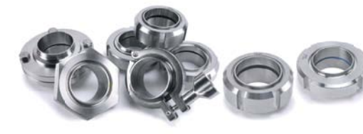
Karimák, clamp csatlakozók és kapcsolódó idomok