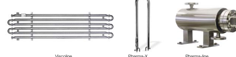
Visoline Pharma-X Pharma-line